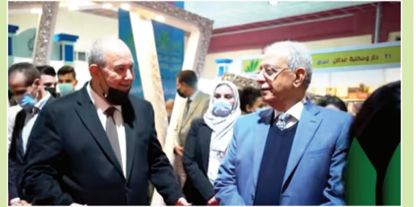
المدى - خاص

"أعجبت بالتعاون الموجودة من الكتب التي شاركت بها دور النشر المختلفة وبالأخص دار المدى، فضلا عن طريقة العرض المميزة لها". وأضاف علاوي ان "الوضع الإيجابي في المعرض، امر إيجابي وهذا الامر متميز وان إقامة المدى لذلك هو تميز حقيقي يضاف لتميزها المستمر في مختلف المحافل".