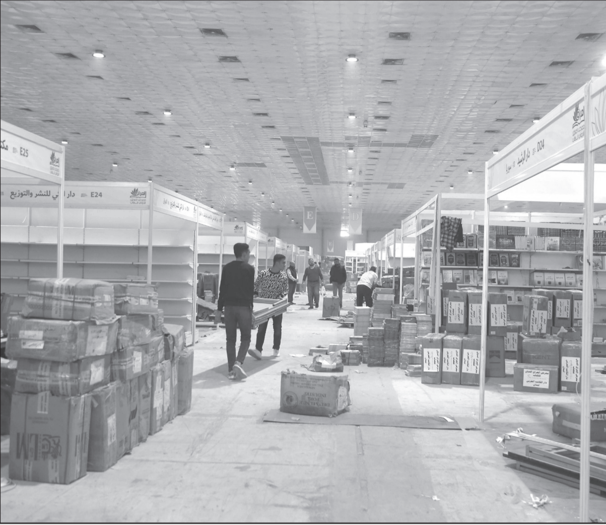
اكتمال الاستعدادات في قاعة المعرض

فيما ستشارك ايضا دار الساقى من لبنان في المعرض وهي من اهم دور النشر التي شاركت ابناء العراق معارضهم بشكل دائم وستدخل بعناوين جديدة ابرزها ماذا تريد من حياتك