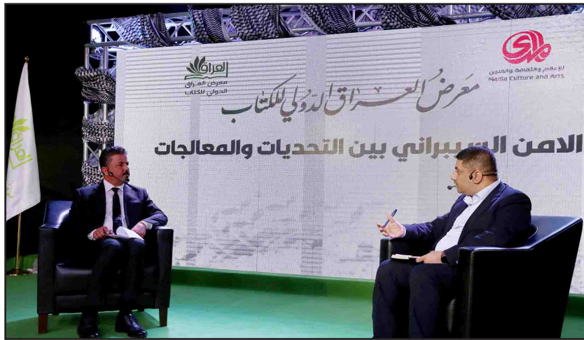
■ تصوير محمود رؤوف

تطبيقات، والأمن السيبراني هو الأدوات والسياسات والإجراءات لحماية هذا الفضاء". وبين، أنه "يوجد سوء فهم وخطأ بين أمن المعلومات والأمن السيبراني، أمن المعلومات للملحمة وغير الملحمة الأمن السيبراني مهتم فقط بالمعلومات الرقمية في الفضاء السيبراني". وتابع، أن "الحكومة العراقية في عام ٢٠٢٠ أقرت سياسة أمن المعلومات وفي عامي ٢٠٢٢ و٢٠٢٣ تم اقرار ٣ سياسات مهمة وهي المسؤولية عن تأمين النظام الإلكتروني وجرى الاطلاع على أنظمة الأمن السيبراني في الدول العالمية وتم اقرار سياسة الأنظمة العامة وجرت مصادقتها من رئيس مجلس الوزراء وتعميمها". وأشار إلى إن "العراق بدأ خطواته بالنظام الإلكتروني وتسجيل بيانات المواطنين الإلكترونيات وتأمينها وتحتوي على هذه الأنظمة بوجود مركز البيانات الوطني التي تحتوي على البيانات". وتابع "لدينا فريق من ٢٠ شخص يعطي تقرير متكامل للجهات الأمنية وتسجيل الثغرات ولجنة عليا برئاسة رئيس الوزراء للشؤون الأمنية"، مشيراً إلى أن العراق مقل على عمل سيبراني حقيقي فيما يخص أمن المعلومات تتضمن إجراء سياسيات وإطلاق دراسات ومؤتمرات تخص الأمن السيبراني". وأضاف أن "أغلب العراقيين يستعملون أنظمة تشغيل غير مرخصة مما قد يعرض معلوماتهم للاستهداف وسهولة الحصول عليها".