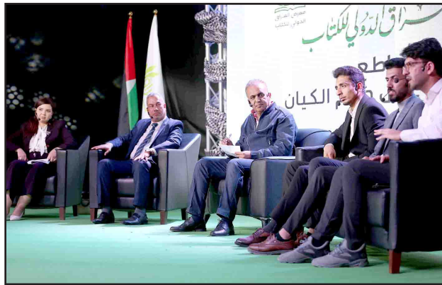
■ تصوير محمود رؤوف

مبيناً "تعتمد ثقافة المقاطعة التجارية على انتشار المعلومات والوعي بين المستهلكين، وبفضل التكنولوجيا الحديثة ووسائل التواصل الاجتماعي، أصبح من الأسهل على المستهلكين