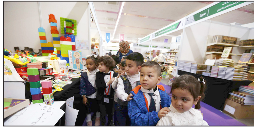
■ تصوير محمود رؤوف

ويؤكد عماد ان "كتاب الحكايات مهم لان طريقة اخراجه بشكل مختلف، فله راغبون كثر، واكثر من شخص قد اشتراه حتى الاطفال الذين يأتون بشكل مبكر في المعرض او الطلاب، اشتروا منه وهذا سيحفظهم لاحقا على حب القراءة".