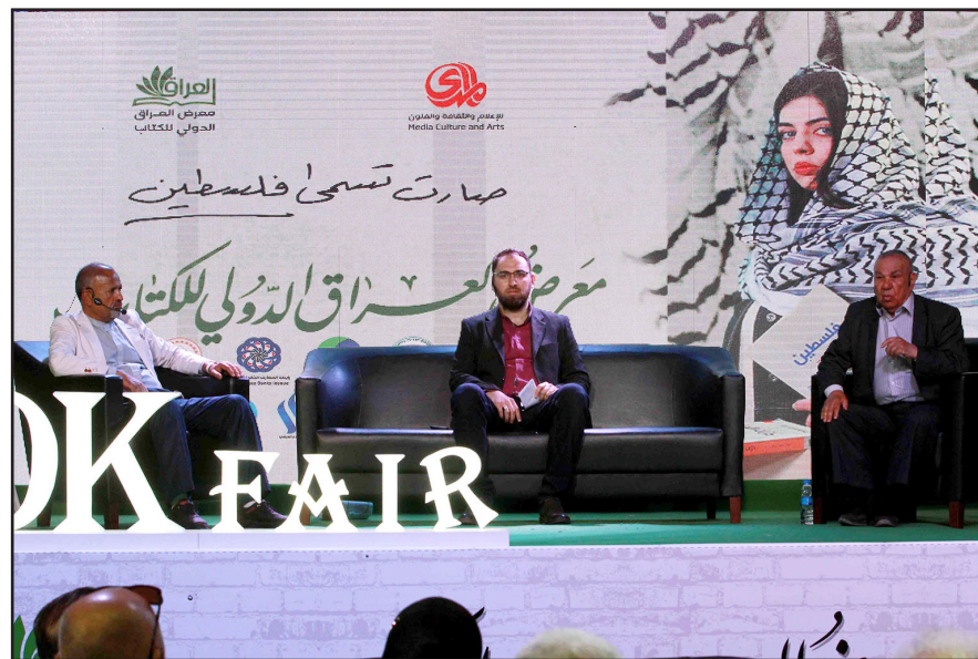
■ تصوير محمود رؤوف

هي "مجموعة من السمات والملامح التي تميز فرداً أو مجتمعاً عن فرد آخر أو مجتمع آخر". وأكد أن الهوية تتأثر بمجموعة من المتغيرات مثل الاقتصادية والاجتماعية والسياسية، بالإضافة إلى النظرة التي يتناول بها المختصون هذا المفهوم". ويوضح أن الهوية "مصطلح غربي وليس عربياً، وبرز بعدها مصطلح "ذات التنوير" وهي الشخصية التي تسعى الى تنوير الاخر، وجرى التمييز بين الهوية الشخصية الصغيرة والشخصية الجمعية الكبرى"، مشيراً إلى وجود علاقة بين الشخصيتين، بعضها إيجابي والآخر سلبي. ويعود الحديث للمعموري، ليؤكد ان "الفلاح" دوراً في "الموروثات الفلسطينية والعراقية"، مبيناً أن "الاساطير أجمعها ذات أصول زراعية عميقة، اذ ان البنية الجوهرية للاساطير هي (الأم الكبرى) التي خلقت وكبرت بالإضافة الى الصيرورة والديمومة". ويضيف أنه "بالعودة للدراسات البحثية نجد ان الأم الكبرى او ممثلاتها من الأئوهة المؤنثة كعشتار، وصلت الى انتاج الخمور"، لافتاً الى انه "كان يصنع في مدينة أور، كما انتجت الخمور والطور وكلها لديها وظائف دينية". من "كانت تسمى فلسطين" إلى "صارت تسمى فلسطين"، تبقى الهوية الفلسطينية هوية كل شخص عربي، وهو موضوع يتطلب إعادة نظر وإطلاع من جديد، بهذا الحديث اختتمت الجلسة من قبل علي شبيب.